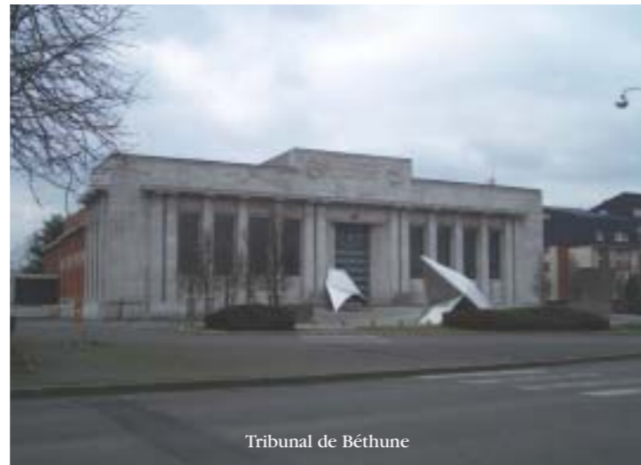
Tribunal de Béthune

Tout à fait. Nous avons été le premier Barreau en grève dès le mois de juin. On s'est beaucoup mobilisés. Il faut dire qu'on a tout de même été touché vu qu'on perd la chambre commerciale du TGI. Nos sommes véritablement un barreau solidaire. Maintenir cette confraternité entre tous mes confrères est réellement un de mes chevaux de bataille pour mon Bâtonnat.